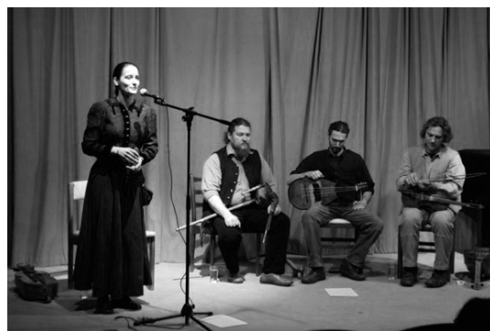
Az eseményen a Kobzos zenekar lépett fel